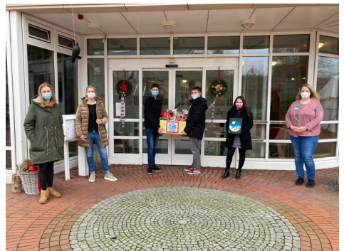
Übergabe an das Elisabethhaus