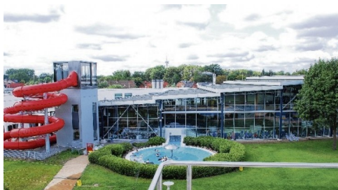
Ziel der ersten Fahrt: Das „Linus-Bad“

außerunterrichtlicher und jahrgangsübergreifender Angebote, in der Schülerinnen und Schüler verschiedene Möglichkeiten zu einer bildenden und sinnvollen Freizeitbeschäftigung kennenlernen sollen.