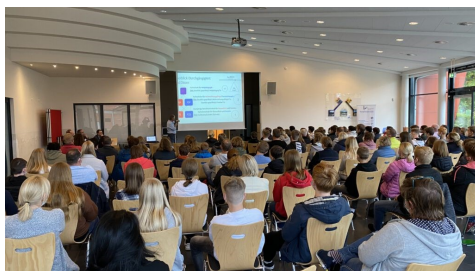
Über 100 Eltern/Schüler ließen sich informieren