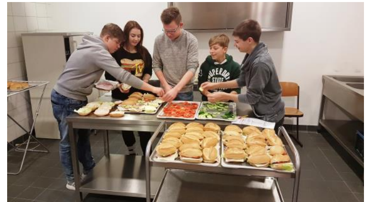
Für Schülerinnen und Schüler von Jg.6-10